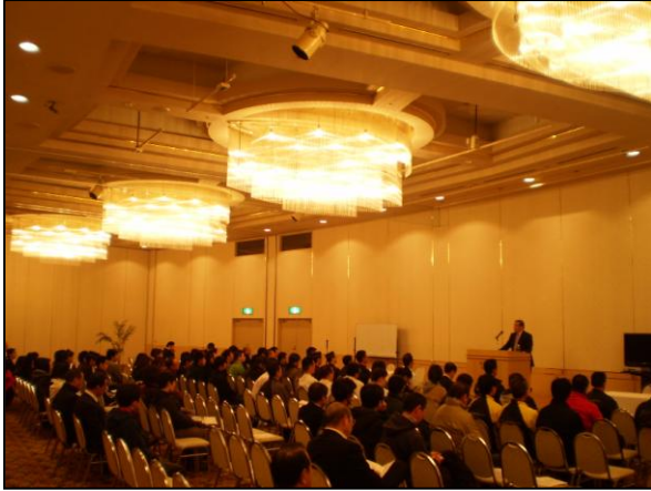
◆ルスツリゾート全従業員対象の研修会(H23.11.15)