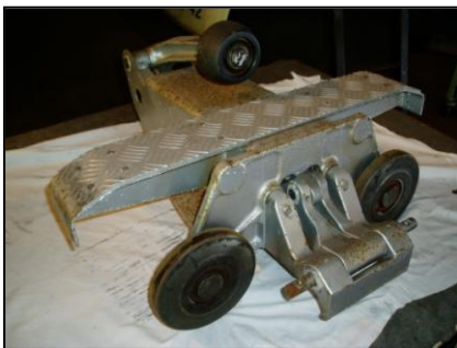
◆ 握索装置分解整備(整備前)

ゴンドラ・リフトの整備は、「整備細則」で定める検査要領及び整備基準に則り、握索装置関係、制動機関係、支柱索受装置関係、油圧装置関係の部品交換及び整備を実施しました。