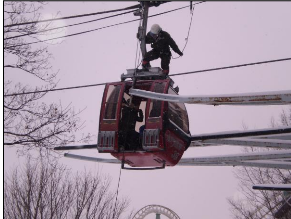
◆ 夏期営業前 ゴンドラ(4人乗)救助訓練(H23.4.25)