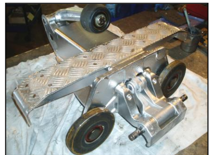
◆ 握索装置分解整備(整備完了後)