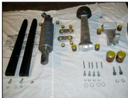
◆ 握索装置分解整備(交換部品)