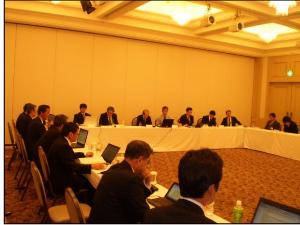
◆加森観光グループ索道担当者会議(H23.6.15)