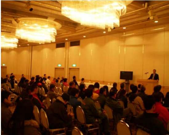
◆ルスツリゾート全従業員対象の研修会(H24.11.21)

技術研修会 :平成24年11月10日(救助装置について講師を招き、種類及び使用方法について研修)