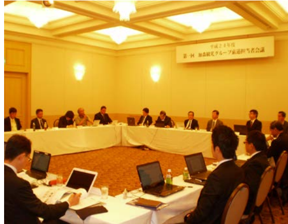
◆加森観光グループ索道担当者会議(H24.6.12)

(3) 社内保安監査部門による内部監査を実施し、索道施設や安全管理について問題点の提起、改善に努めました。