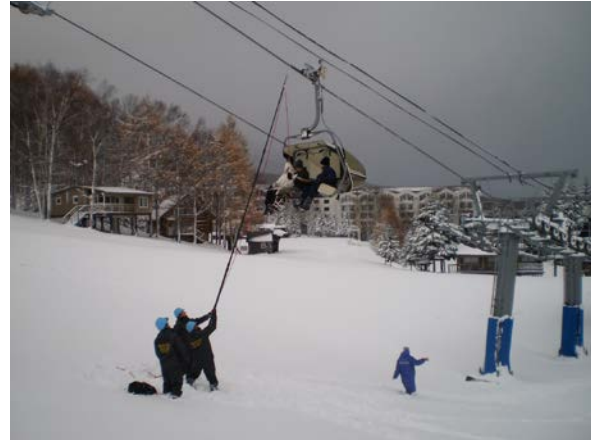
◆ 夏期営業前 ゴンドラ(4人乗)救助訓練(H23.4.26)